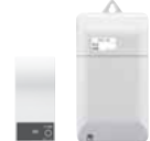
マイコンメータ用 連動無線ユニット