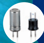
熱線型半導体式 センサ