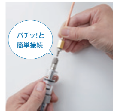
パチッと簡単接続

▶▶▶ 採取管とフィルタ部分がワンタッチで接続できるので、取り付け・取り外しの作業性がアップしました。