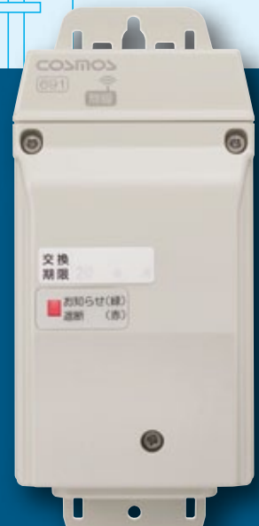
マイコンメータ遮断用無線装置 RM-691 〈高圧ガス保安協会検定合格品〉