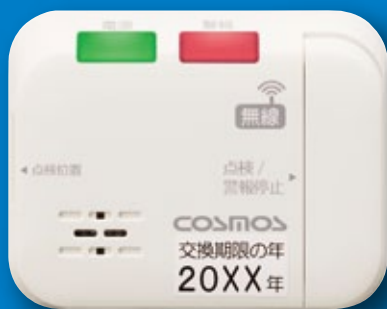
ガス警報器 XL-691 〈高圧ガス保安協会検定合格品〉

ガス警報器とマイコンメータを無線連動 万一のガス漏れの際もガス供給を自動で遮断します