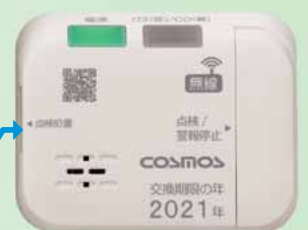
LPガス検知・警報部