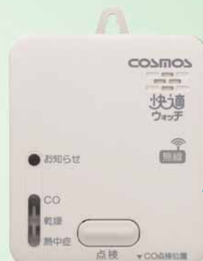
快適環境おしらせ・CO検知部

COセンサ搭載により、 不完全燃焼による CO(一酸化炭素)中毒の防止や 火災の早期発見に役立ちます