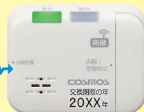
LPガス検知・警報部