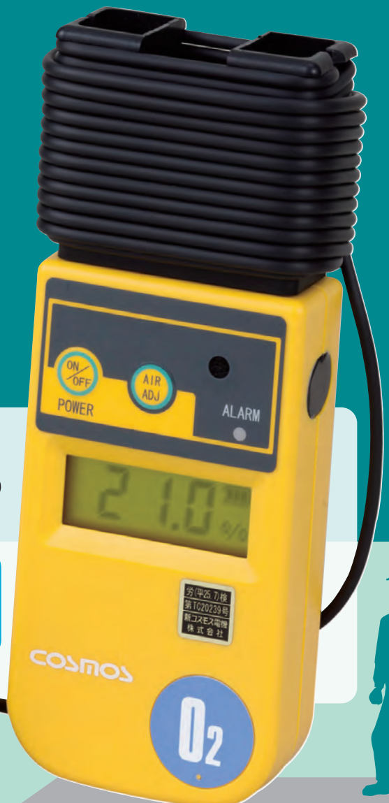
▲ XO-326ⅡsA (5mコード)