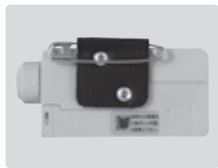
安全ピンアダプタ