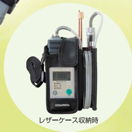
レザークース収納時